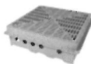
KOSZE DLA ZIELONYCH DACHÓW